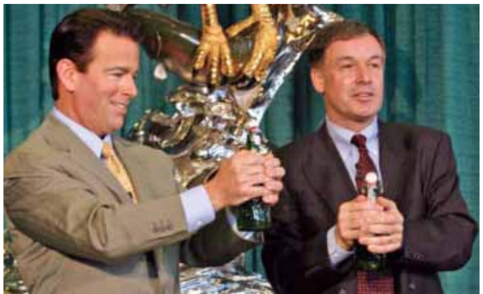
August Busch IV (Anheuser-Busch) en Ab Pasman (Grolsch, rechts) bezegelen hun veelbelovende distributiedeal.

* in 2005 exclusief eenmalige niet-operatieve laste van 7,3 mln. na belasting ** exclusief plusdividend van 0,33 mln.