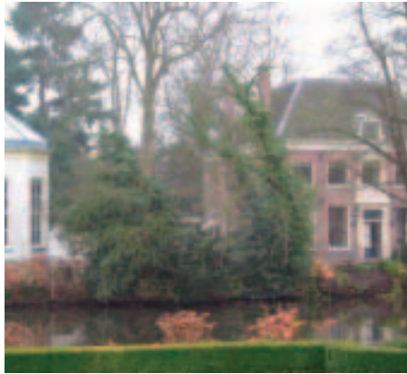
Van Vlissingens landhuis kostte 5,4 miljoen euro.

Ubbink wordt begin 2001 verkocht aan investeerder Victor Muller, die het beursfonds ombouwt tot participatiemaatschappij Maverix Capital. De aandelen van de