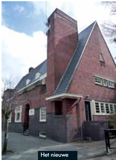
Het nieuwe zenuwcentrum van de BV Erven Frits.

Drie jaar na zijn overlijden is het tijd om de balans op te maken. Waaruit bestaat het familievermogen precies? Hoe beheren de erven dat? Hebben zij voor een nieuwe strategie gekozen, of blijven zij trouw aan de oude koers? Zijn zij even betrokken en kundig als hun vader? Of besturen zij de belangen op afstand, als negentiende-eeuwse rentmeesters? Ook is het de vraag hoe hun imperium zich houdt onder de financiële crisis en de economische recessie, en hoe de nieuwe eigenaren hierop reageren.