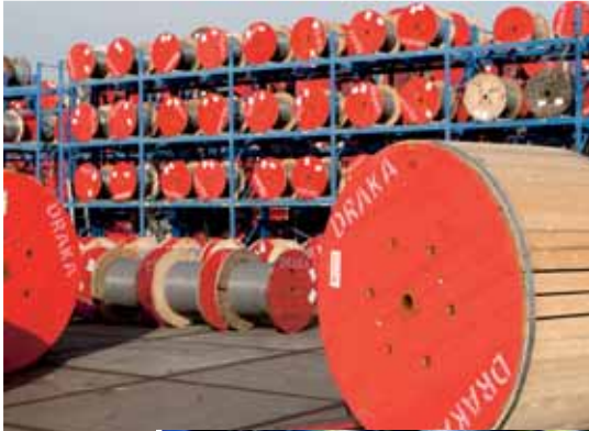
Waaier van belangen: het Noord-Zuid-Hollands Koffiehuis, kabeldraaier Draka, winkelen Makro en Diamond Tools.