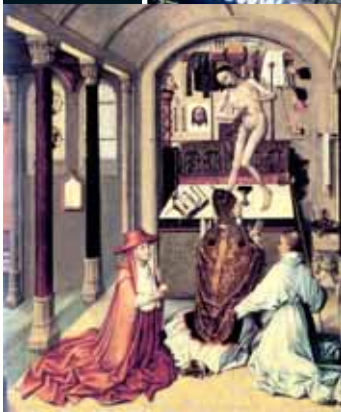
De mis van de Heilige Gregorius, in 1993 voor fl. 450.000 gulden gekocht bij kunsthandel Salomon Lilian.