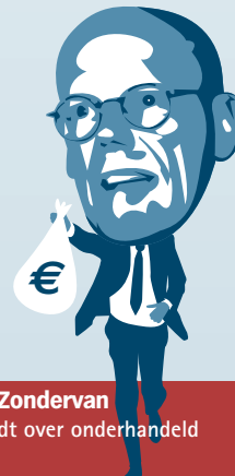
Mac Zondervan • wordt over onderhandeld