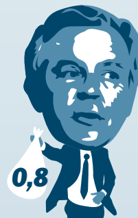
Herman Scheffer • gouden handdruk 0,8 miljoen

Moesten aftreden na onderlinge ruzie en zwaar tegenvallende resultaten